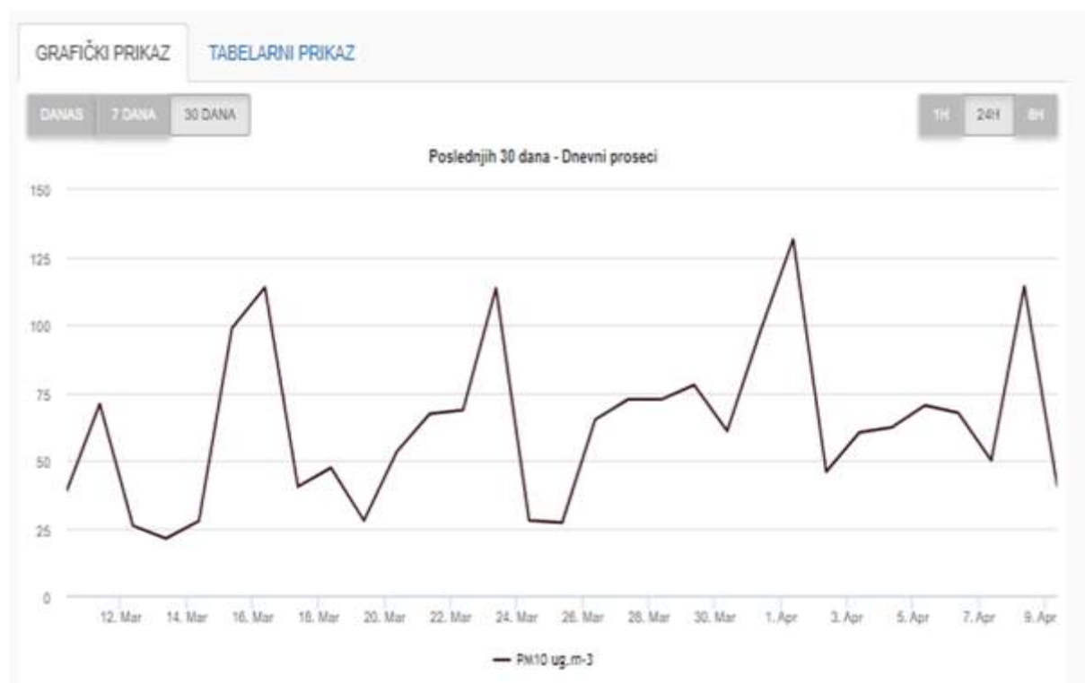
Слика 6. Ход дневних вредности PM_{10} на АМСКВ Поповац у периоду 10.03. – 08.04.2024.

По прелиминарним подацима за 2023. број дана са прекорачењима је око 140. Ситуација се није променила на боље ни у 2024, судећи по прекорачењима у периоду 10.03. – 08.04.2024, Сл. 6.