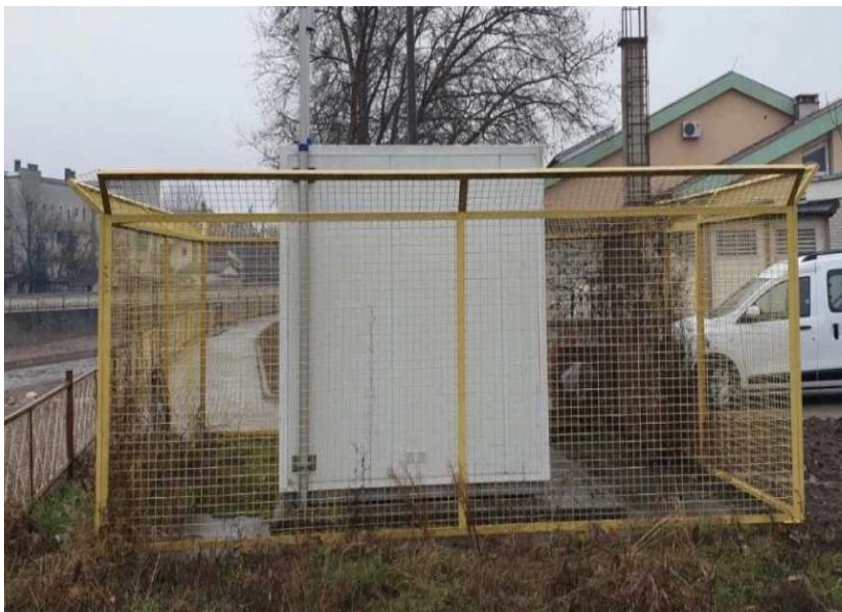
Слика 4. АМСКВ Параћин

АМСКВ Поповац је лоцирана у близини цементаре, налази се на надморској висини од 200 m, са координатама 43° 54' 38" N и 21° 30' 30" E. На слици 5 је приказана локација станице.