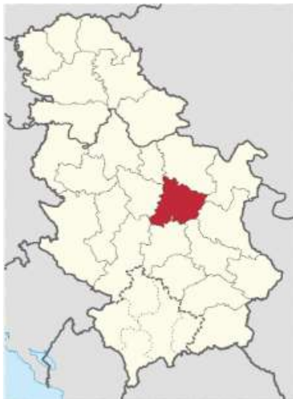
Слика 1. Карта Србије са назначеном позицијом Поморавског округа

Општина Параћин је смештена у источном делу Европе, у Републици Србији, са координатама 43^{\circ} 51' 33''\text{С} ; 21^{\circ} 24' 37''\text{И} .