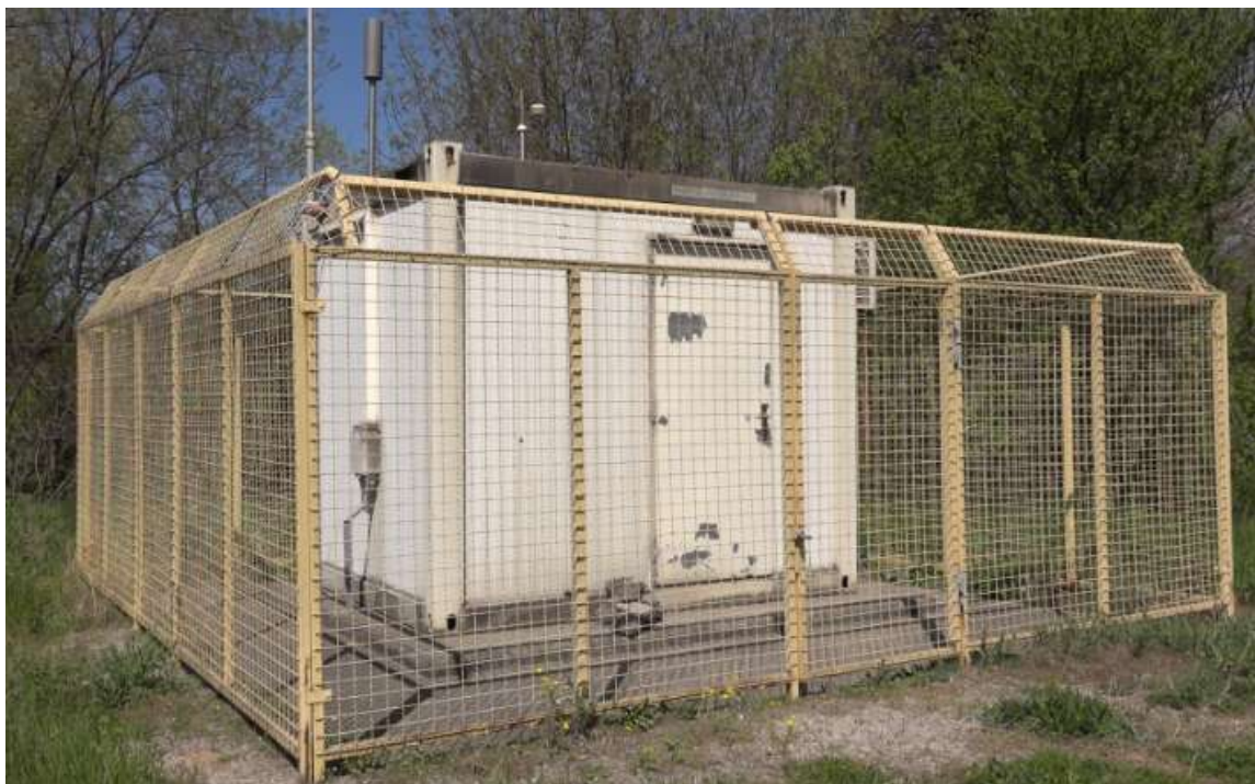
Слика 5. АМСКВ Поповац