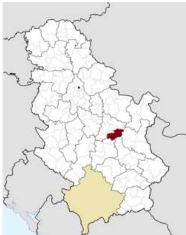
Слика 2. Карта Србије са назначеном позицијом општине Параћин